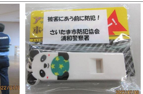
<ホイッスルをいただきました>