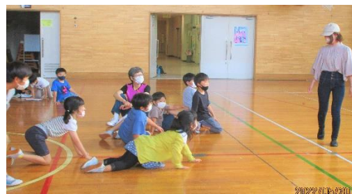
<間違い探しファッションショー>