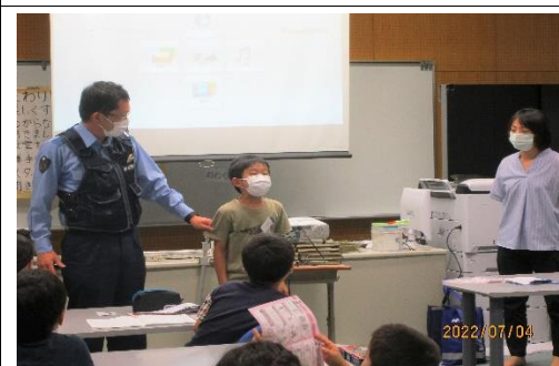
<大きな声で「助けて～」>