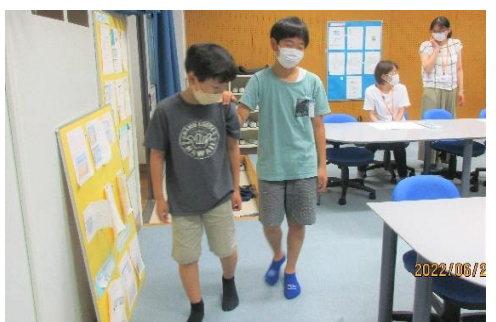
<目を閉じて歩くのは不安…>

自分の誕生日を言葉で発しないでお友だちに伝え、1月1日から12月31日まで順番に並ぶゲームです。答え合わせでは自己紹介も行い、「一番好きなもの」を発表しました。間違い探しファッションショーではスタッフがモデルになり、変更前と変更後に2回ランウェイを行い、グループで違いを5つを見つけました。皆、細かいところまでよく気が付き驚きました。最後にお金持ちジャンケンをして、1億円札を負けた相手からもらうゲームでは勝った人は、大喜びでした。負けた人には「皆に幸せを与えてくださりありがとう」というねぎらいの言葉がスタッフリーダーからありました。このメンバーのお子様たちとスタッフで楽しく活動させていただきますので、引き続きご協力の程よろしくお祈りします。