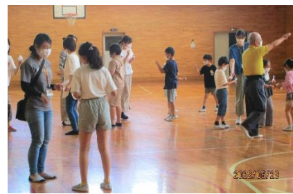
<お金持ちジャンケン>

【なかよくなろう！オリエンテーション】5月28日(土) 5月30日(月) 担当 ひまわりEASTスタッフ